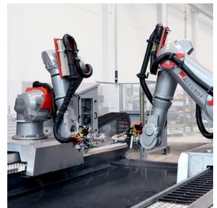
Dual-Robotersystem zur zerstörungsfreien Prüfung (Fill GmbH)